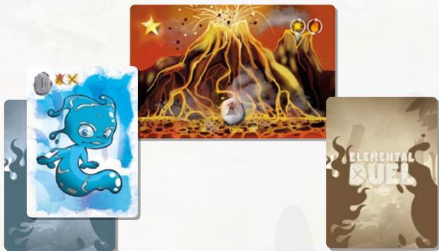
Obrázek 4, Obrázok 4